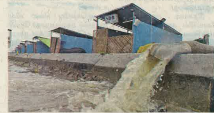
▲ சென்னை மற்றும் அதன் சுற்று வட்டாரப் பகுதிகளில் நேற்று பெய்த மழையின் காரணமாக திருமழிசை தற்காலிக காய்கறி சந்தையில் உள்ள கடைகளில் தேங்கியுள்ள மழைநீர் மோட்டார் மூலம் வெளியேற்றப்பட்டது.

மாவட்ட ஆட்சியர்கள், சிறப்பு அதிகாரிகள், காவல் துறை அதிகாரிகள் காணொலி வாயிலாக தங்கள் மாவட்ட நிலவரம் குறித்தும், ஊரடங்கு தொடர்பாகவும் கருத்துகளை தெரிவித்தனர்.